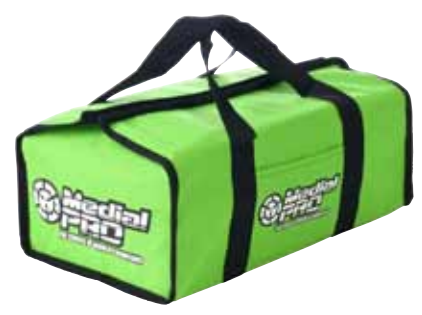
MPB-0101 SAC DE TRANSPORT (40 X 22X 15CM)