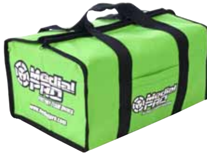
MPB-0100 SAC DE TRANSPORT (40 X 28 X 20CM)