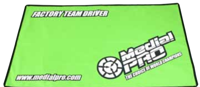
MPB-0114 PIT MAT - MEDIAL PRO