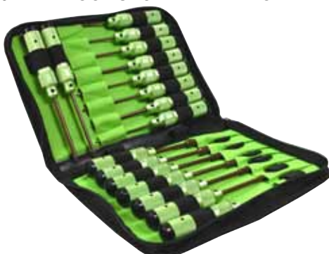
MPB-0110 XP TOOL SAC - MEDIAL PRO